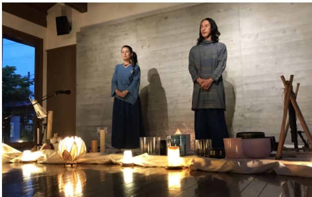
同日開催：屋久杉玉磨きワークショップも興味深いです (裏面にご案内があります)